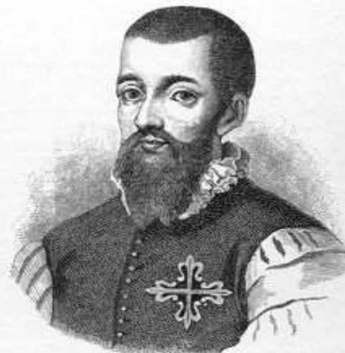
1. Garcilaso de la Vega.