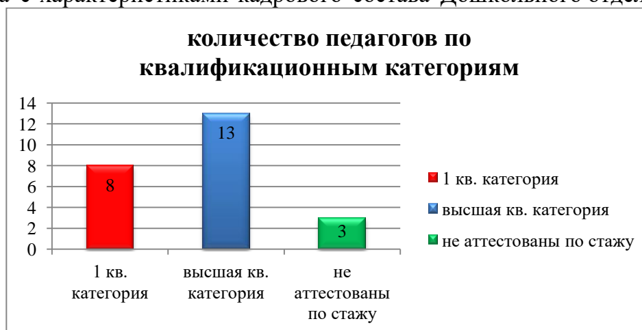
Диаграмма с характеристиками кадрового состава Дошкольного отделения

Курсы повышения квалификации в 2021-22 году прошли 23 работников Дошкольного отделения. На 1.09.2021года 1 педагог проходит обучение в вузе по программе Аспирантуры.